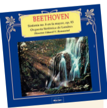
Sinfonía 8 / Beethoven Artista: Sinfónica de Londres Género: Orquestal Disquera: Marler

La Séptima : quintaesencia beethoveniana ; la Octava , turbulenta mixtura de lo añejo y lo nuevo: minueto de estilo antiguo, más rápido que el scherzo que utilizaba frecuentemente, evidenciado en el tercer movimiento central. / Originalidad, elementos lúdicos e ingenio en columpio con cierta rudeza que produce sobresalto. Distribución insólita en el finale con