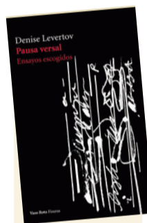
Pausa Versal Autora: Denise Levertov Género: Ensayo Editorial: Vaso Roto, 2017

Pausa versal (Vaso Roto, 2017): ensayos escogidos de Denise Levertov (Inglaterra, 1923-Estados Unidos, 1997): "una de las poetisas esenciales del siglo XX norteamericano, probablemente quien con más lucidez ha escrito sobre el poema contemporáneo y su contexto". / Cuaderno que recopila estudios sobre la obra de Rilke, Anne Sexton, T. S. Eliot, Robert Duncan y sobre todo de William Carlos Williams. Penetrantes exégesis que van de dilucidaciones entre la forma y el contenido, el universo personal del poeta, la música del verso, la mirada del poeta, las relaciones de las cosas con la pronunciación del poeta y su biografía , entre otros temas relacionados con la creación poética.