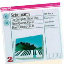
Tríos con piano / Schumann Artista: Trío Beaux Arts Género: Cámara Sello: Philips

Segundo Trío inicia en clave mayor desde asombrosa melodía cancioneril del adagio que cae en torrente mientras el piano crea un 'nerviosismo armónico' que rompe con las convenciones distributivas. Espiritual diálogo entre los instrumentistas en una atmósfera de exaltado humanismo. Dicen los especialistas que hay un Tercer Trío que