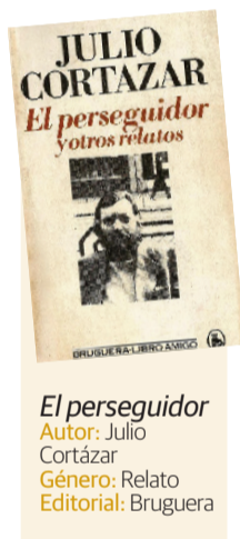
El perseguidor Autor: Julio Cortázar Género: Relato Editorial: Bruguera

Johnny habla del tiempo, una de sus alucinaciones; Bruno recuerda anécdotas, como aquella de un ensayo con Miles Davis donde Johnny se pone a gritar "Esto lo estoy tocando mañana". Bruno acaba