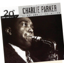
The Best of Charlie Parker Artista: Charlie Parker Género: Jazz/ Bebop Sello: Verve

Acentuaciones, síncopas, silencios, densidades: sutileza de un instrumentista motivado por intuiciones sobrenaturales. Dios sonrío, se lava las manos en las sinuosidades del blues.