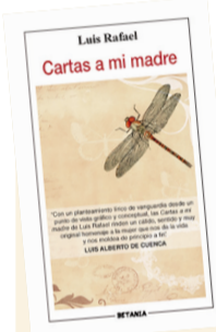
Cartas a mi madre Autor: Luis Rafael Género: Poesía Editorial: Betania, 2020

C artas a mi madre, de Luis Rafael, cierra un ciclo y extiende las propuestas emplazadas en Cartas al padre (2000) y Cartas al hijo (2008). La estirpe en las coordenadas de las devociones y en esa fruición de diálogo íntimo donde el amor abandona artificiales sentimentalismos. "Paridora madre / Ahogada / Por las mareas / De la Isla". Las estaciones suscriben el ondulado sacudir de los ascensos. "...Madre / =Flor de agua/ (Forzada a la intemperie) / Nací /: Con la sien -tatuada / Por mis uñas -nonatas / La madre distintiva /: Fugó su huella /: y sembró de azar / Mi rostro / En la incertidumbre / De los días". Imágenes iluminadas en una 'intranquilidad lingüística' de trances arriesgados. Luis Rafael aborda la espiritualidad a través de alegorías inscritas por un asombro de exaltada franqueza. "Nunca más / -Escucharé tu voz /: Lla-