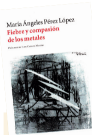
Fiebre y compasión de los metales

F iebre y compasión de los metales (Vaso Roto, 2016), de María Ángeles Pérez López: exaltación y piedad en los fillos de las insinuaciones: "Tijeras que soñaron con ser llaves / acercan su metal hasta la llama / y llozan aleación incandescente, / el filo en que florecen las heridas / sobre el silbido agudo del acero". La evocación se unta de una resina plomiza y transita por veredas de nostalgias encadenadas a instantes de venturas que nombran las conjeturas. "El hacha silba su canción de acero y amputa la memoria, el silabario, / la mano en que se escriben las palabras".