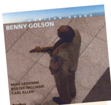
Horizon Ahead Artista: Benny Golson Género: Jazz Sello: HighNote

En 1958, el baterista Blakey lo nombra director musical de la agrupación Jazz Messengers hasta la formación de