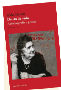
Delito de vida Autora: Alda Merini Género: Poesía / Memorias Editorial: Vaso Roto, 2018

En este volumen de roja carátula con el rostro de la poeta en medio del humo del cigarro, el lector encuentra los índices de una pasión vagabunda: resar-