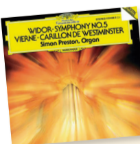
Sinfonía 5 /Widor Artista: Simon Preston Género: Instrumental Sello: Grammophon

El aclamado quinto movimiento, se conoce como la "Tocatta de Widor", su pieza más apreciada de unos seis minutos de duración. Popularidad sustentada por la frecuente utilización como motivo musical en los cortejos festivos de Navidad, sacramentos y enlaces matrimoniales. La melodía de la "Tocatta de Widor" se asienta en un ajuste de arpeggios vertiginosos en staccato que trazan dicciones en quintas hasta Do mayor y G mayor en sucesiones. Cada frase