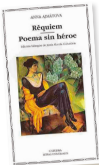
Réquiem/Poemas sin héroe Autor: Anna Ajmátova Género: Poesía Editorial: UNAM

La autora de La bandada fue un testigo excepcional de la convulsa historia del siglo XX y, más que todo, de las zozobras del pueblo ruso antes y después de la caída de los zares. "Desde la infancia temo los disfraces. / Siempre me pareció / Que una sombra superflua / "sin rostro y sin nombre" / en ellos acechaba...": premonición de los años de terror que le