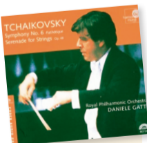
Serenata para cuerdas / Chaikovski Artista: Royal Philharmonic Orchestra Género: Orquestal Sello: Harmonia Mundi

PIOTR ILICH CHAIKOVSKI (Vótkinsk, 1840 - San Petersburgo, 1893), compositor ruso del periodo Romántico; autor de algunas de las obras de música de concierto más acreditadas del catálogo de las principales orquestas sinfónicas actuales: los ballets El lago de los cisnes , La bella durmiente y El cascanueces ; la Obertura 1812 , la obertura-fantasia Romeo y Julieta , Primer concierto para piano , Concierto para violín ; Sinfonías Cuarta, Quinta y Sexta ; y la ópera Eugenio Oneguín , entre otras piezas muy cotizadas en las salas de concierto de todo el mundo.