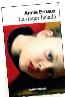
La mujer helada

La autora de la celebrada novela Memoria de una chica (2016) relata cómo los gestos de esta ama de casa se han ido immobilizando por el hundimiento de sus sensaciones vitales , por la disgregación de la identidad en las rutas de un sometimiento al que las mujeres son conminadas de manera irremediable. Ernaux con osadía y franqueza, corre la cortina de