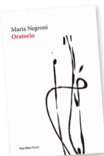
Oratorio Autora: María Negroni Género: Poesía Editorial: Vaso Roto, 2021

Palabras: pequeñas excusas para la resonancia. Escritura que avanza en la configuración de una pregunta: ¿De dónde viene el verso? "Se escribe contra lo escrito", afirma la autora de Arte y Fuga : "se espera / que el deseo encuentre / formulación ninguna // que el corazón acepte la mansedumbre // tiempo hace que no hace / más que un vacío atronador". Oratorio: la ausencia de Dios es también su presencia. Entramos