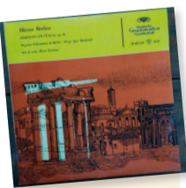
Haroldo en Italia / Berlioz Artista: Orquesta Filarmónica de Berlín Género: Orquestal Sello: Grammophon

I. Haroldo en las montañas : escenas de melancolía, gozo y bienestar: prelude