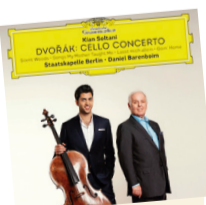
Concierto para Violonchelo / Dvořák Artista: Kian Soltani Género: Concierto Sello: Grammophon

"Allegro": tópicos melódicos principales antes de la entrada del solista. Desarrollo variado de las tramas melódicas por parte del concertino que precede la refulgente intervención de