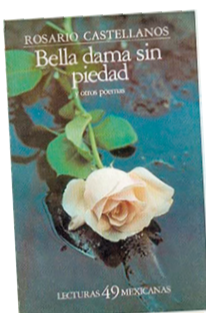
Bella dama sin piedad Autor: Rosario Castellano Género: Poesía Editorial: FCE

B ella dama sin piedad y otros poemas (FCE, Colección Lectura Mexicana No. 49, 1984), de Rosario Castellanos (Ciudad de México, 1925-Tel Aviv, 1974) me acompaña en estos días de mayo; alguien se preguntará: ¿por qué un libro editado hace más de 30 años? La permanencia de una voz sustancial de la literatura mexicana, única respuesta de las razones de retomar un cuaderno de poemas de la autora de Oficio de tinieblas . "Escribo porque yo, un día, adolescente, / me incline ante un espejo y no había nadie. / El vacío": respuesta de Castellanos a un imaginario reportero que le preguntó "¿por qué escribía".