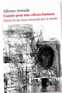
Cuánto pesa una cabeza humana Autor: Alfonso Armada Género: Poesía Editorial: Vaso Roto, 2021

Cincuenta jornadas (del domingo 15 de marzo al domingo 3 de mayo de 2020) que terminan en una coda: los lectores hemos sido testigos de una coral en que lo que hemos oído es cier-