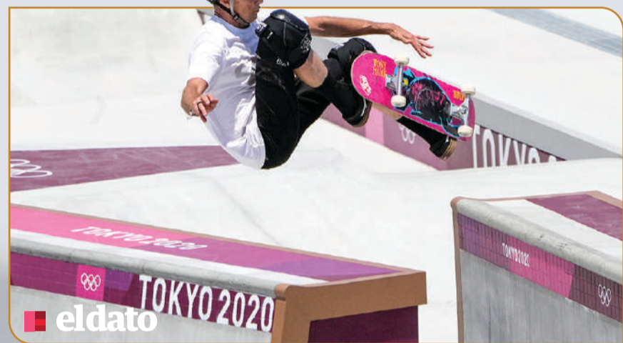
EL ESTADOUNIDENSE Tony Hawk, el skater más famoso del mundo, compartió en 2015 un video de Rayssa Leal haciendo un truco vestida de hada. El patinador está de visita en Japón.

Las otras disciplinas que debutan en el programa olímpico en la edición en curso son surf, karate, escalada deportiva, basquetbol 3x3 y el ciclismo BMX.