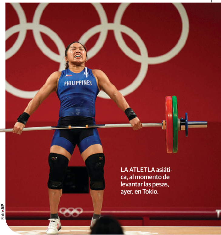
LA ATLETA asiática, al momento de levantar las pesas, ayer, en Tokio.