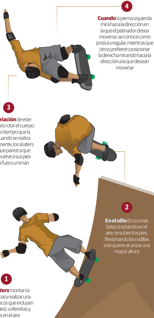
Gráfico • Gerardo Núñez • La Razón

Las primeras ruedas para practicar eran de metal, pero en la década de 1970 se introdujeron las de poliuretano.