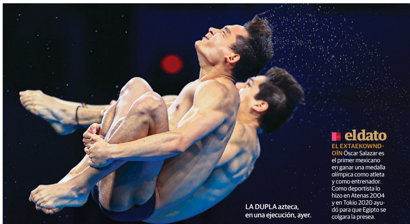
LA DUPLA azteca, en una ejecución, ayer.

Sin una gran parafernalia ni una devoción desbordada por estos Juegos Olímpicos, de cierta manera este hecho hace de esta olimpiada la más humana de todas.