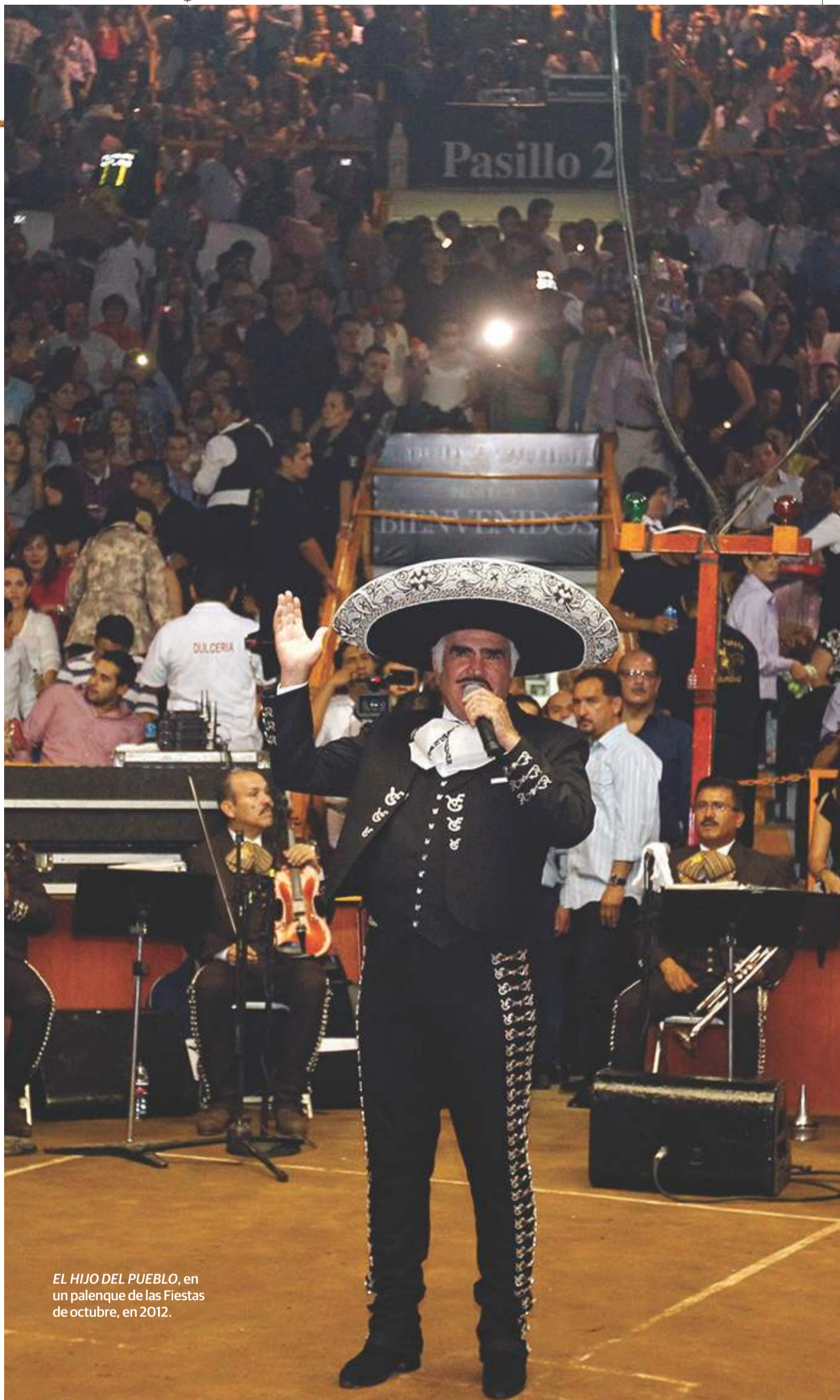
EL HIJO DEL PUEBLO, en un palenque de las Fiestas de octubre, en 2012.