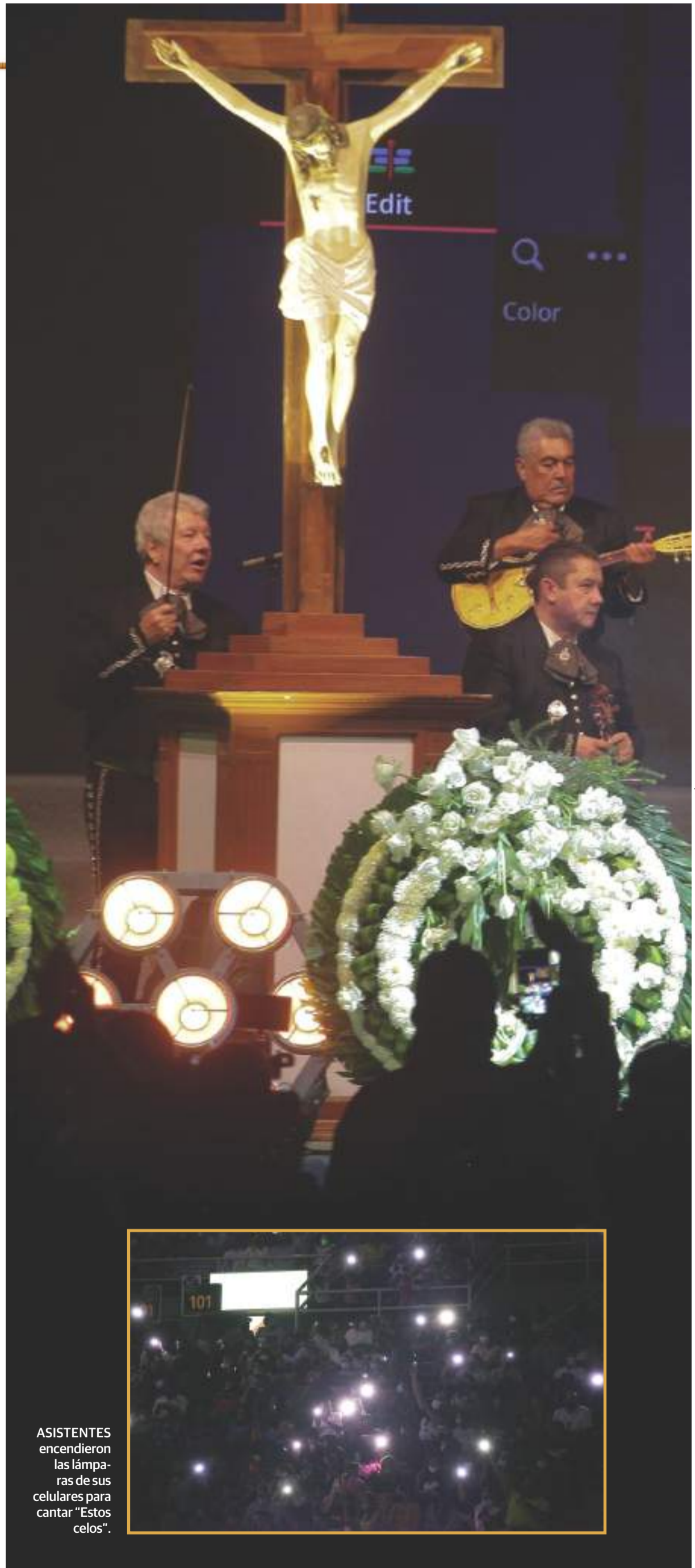
ASISTENTES encendieron las lámparas de sus celulares para cantar "Estos celos".

Hoy a las 15:00 horas se realizará una misa de cuerpo presente en el recinto y posteriormente tendrá lugar de manera privada el entierro en su rancho.