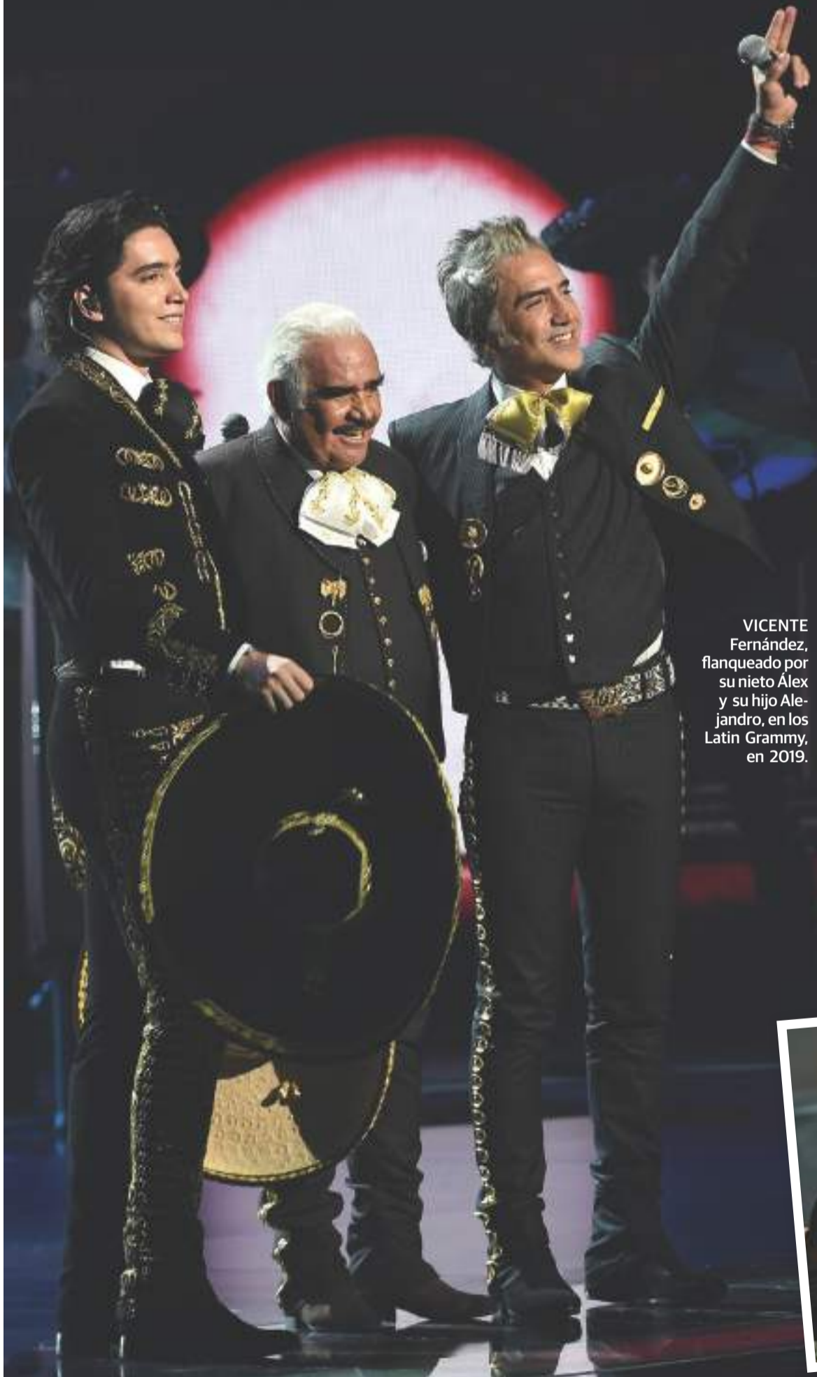
VICENTE Fernández, flanqueado por su nieto Alex y su hijo Alejandro, en los Latin Grammy, en 2019.

CHENTE impulsó, primero, la carrera de Alejandro, su hijo, y después la de Alex, su nieto; para ambos fue su sensei ; cada uno tiene su estilo y se ha ganado el cariño del público