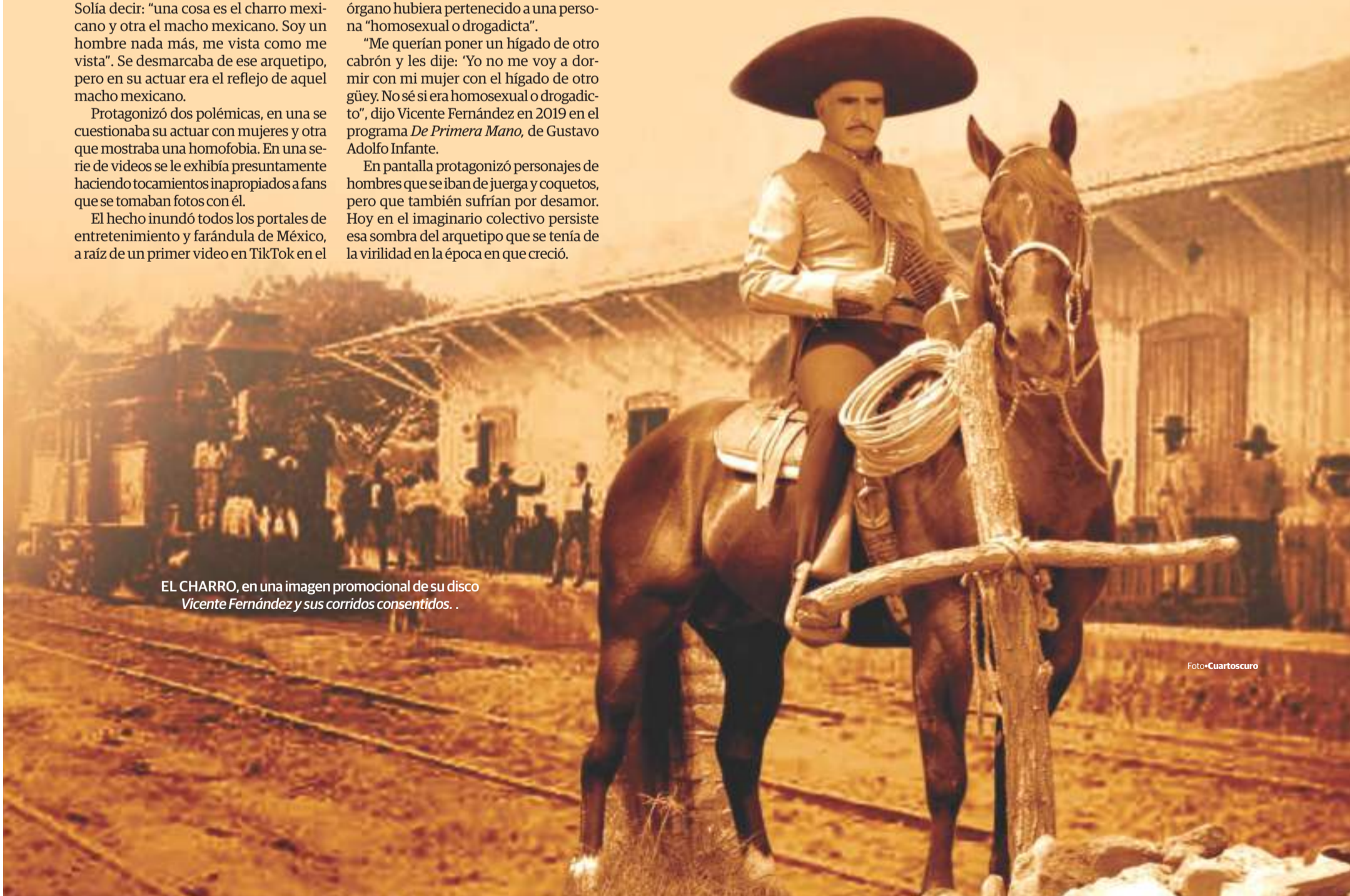
EL CHARRO, en una imagen promocional de su disco Vicente Fernández y sus corridos consentidos .

En la biografía no autorizada El último rey (Planeta), la periodista Olga Wornat señala que presuntamente el cantante no soportaba a Juan Gabriel por ser homosexual.