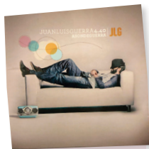
A son de Guerra Artista: Juan Luis Guerra Género: Bachata, merengue... Disquera: Capitol, 2021

A Son de Guerra (Capitol Music, 2021), reedición del fonograma “posiblemente el más variado y divertido de mi trayectoria. Colorido, estimulante y veraniego”, comenta el intérprete de “Visa para un sueño”. Once composiciones de su autoría con invitados de lujo (Juanes y el trompetista de jazz Chris Botti). Abre La 440 (guitarra, piano, teclados tambora, congas, maracas, claves, güira, saxofones, trombones, bajo, drums y timbales) con un merengue de