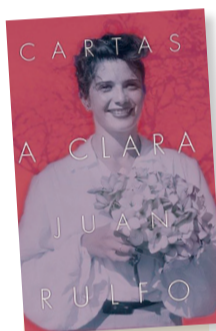
Cartas a Clara Autor: Juan Rulfo Género: Epístola Editorial: RM/ Fundación Juan Rulfo