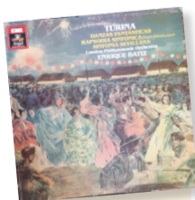
Danzas fantásticas Artista: Orquesta Sinfónica de Londres Género: Orquestal Disquera: EMI

Tres secciones. Exaltación , jota aragonesa de sublimada cadencia. "Parecía como si las figuras de aquel cuadro incomparable se movieran dentro del cáliz de una flor"; Ensueño , zortziko vasco en compás de 5/8 de ritmo contagioso. "Las cuerdas de la guitarra, al sonar, eran como los lamentos de un alma que no pudiera más con el peso de la amargura"; Orgía , farruca andaluza de raigambre flamenca. "El perfume de