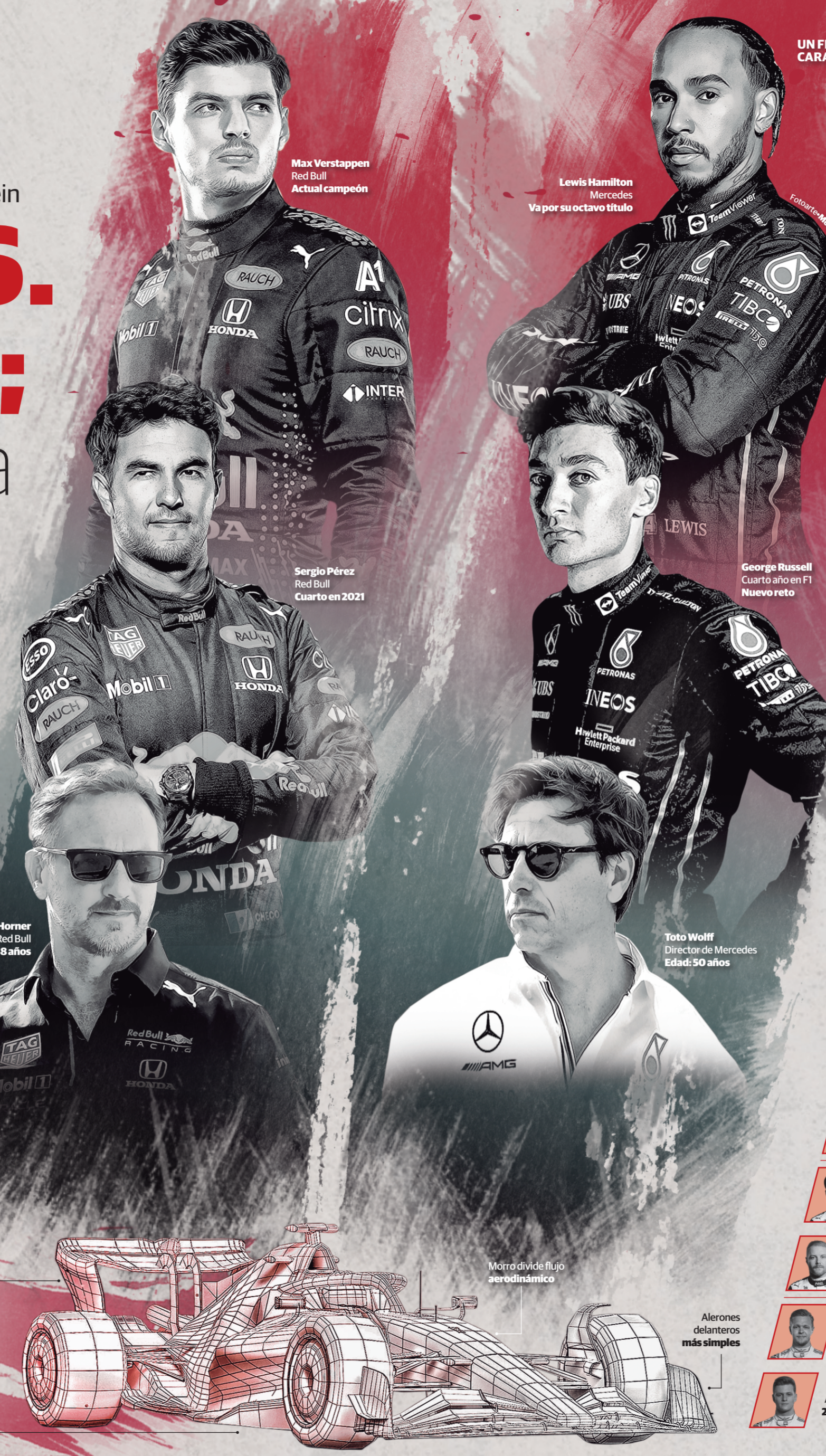
Max Verstappen Red Bull Actual campeón

Por su parte, Guanyu se convirtió en el primer piloto oriundo de China en la Fórmula 1, mientras que Magnussen entró de último momento para sustituir en Haas al ruso Nikita Mazepin, quien el pasado 5 de marzo vio concluido su contrato con la escudería estadounidense debido a la guerra que su país sostiene con Ucrania desde el pasado 24 de febrero.