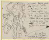
Pablo Picasso, Carta a Leo y Gertrude Stein, París, 17 de agosto de 1906.

Los labios Se observa la palabra escrita en alemán "Kalle" en alemán, que podría tener varias interpretaciones como la voluntad de mantener la obra en secreto, para evitar que el autor fuera perseguido por los nazis, o la persecución y censura que recibía el régimen.