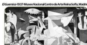
El Guernica, 1937. Museo Nacional Centro de Arte Reina Sofía, Madrid.

No podía faltar una obra maestra, creada en blanco y negro y una amplia paleta de grises, tenía en su origen una expresión vanguardista de la España de 1937.