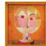
Seneca o cabeza de hombre senil. Pintura cubista de 1922 hecha por el artista Paul Klee. Actualmente se encuentra en el Kunstmuseum Basel.

Homenaje El cuadro es "híbrido" entre las características pictóricas del malagueño y las de Klee, ya que pretendía ser un regalo para el artista alemán.