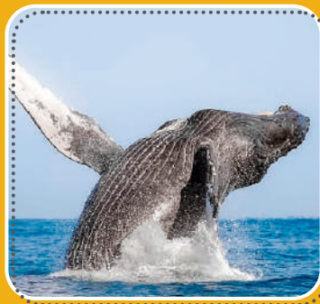
AVISTA ballenas grises en Baja California Sur.