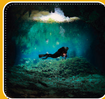
NADA y aprecia el paisaje subacuático del Gran Cenote de Tulum.