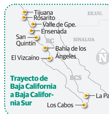
Trayecto de Baja California a Baja California Sur

La última parada es Bacalar, Pueblo Mágico conocido por su laguna de siete tonos de azul que ofrece el espacio ideal para bucear, nadar y practicar snorkel. También es la puerta de entrada a las cavernas subacuáticas del Cenote Azul.