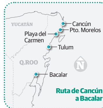
Ruta de Cancún a Bacalar

fruta del avistamiento de la ballena gris y relájate en los spas que ofrecen distintas técnicas de masajes.