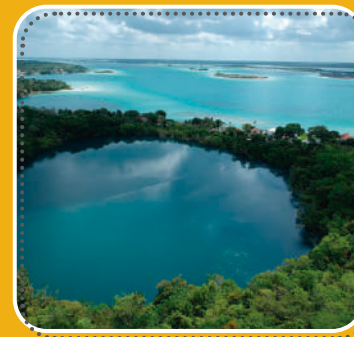
BUCEA en el espectacular Cenote Azul de Bacalar.

• Por Karen Rodríguez karen.rodriguez@razon.com.mx