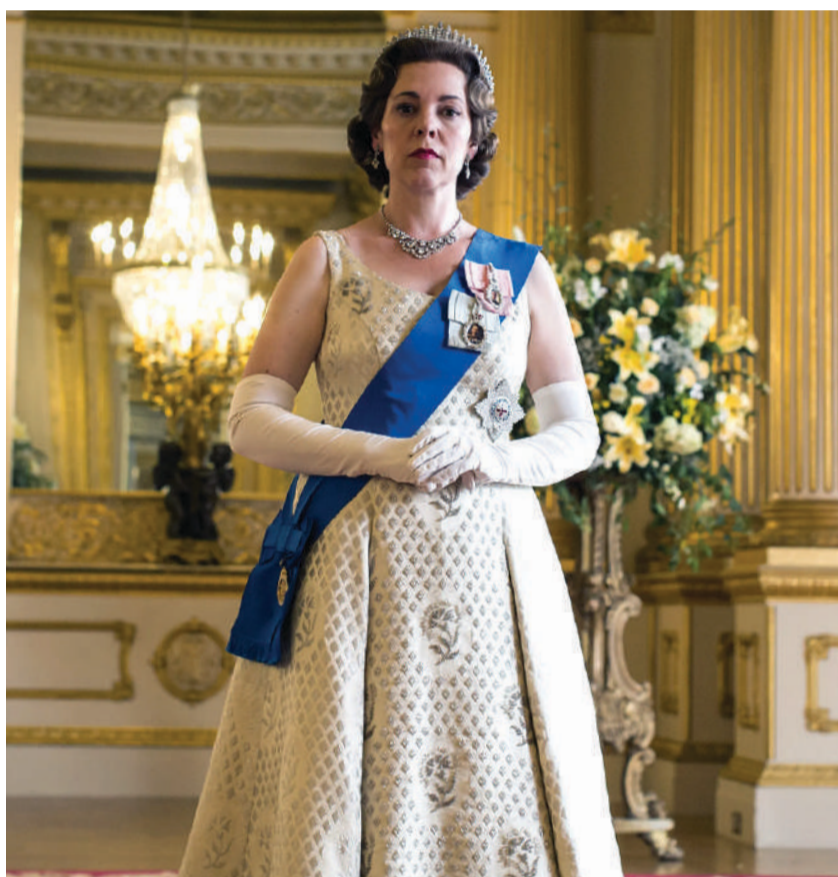
The Crown 2016 a la fecha, de Peter Morgan

Éstas son las principales producciones que se han abordado sobre la monarca o la familia real.