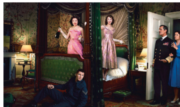
Un escape real

Clarie Foy, Olivia Colman e Imelda Staunton interpretan a Isabel II en distintas épocas de su vida. Se narran las distintas etapas de la vida de la reina Isabel, desde su juventud, hasta la actualidad.