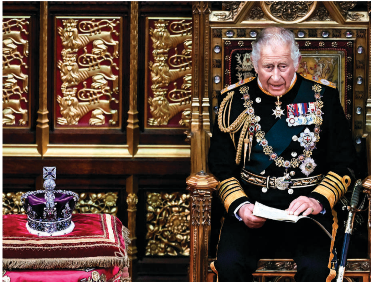
CARLOS III, el nuevo rey de Gran Bretaña, ascendió al trono tras la muerte de su madre, ayer.

Una de las reinas más recordadas del Reino Unido, también perteneciente a la casa Hannover, gobernó por 64 años.