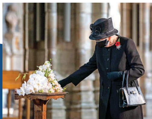
Ilustración | Ismael F. Mira | La Razón

PANDEMIA DE COVID-19. El 5 de abril de 2020, Isabel II dio un mensaje de aliento y de agradecimiento a los trabajadores de salud y a quienes desempeñaban funciones en servicios esenciales, un país que como el resto del mundo, sufrió un quiebre económico por los millones de contagios y vidas perdidas. Como una abuela, abrazó a los ingleses y les deseó que salieran victoriosos del desafío. La misma reina contrajo la enfermedad en 2022, de la cual se recuperó rápidamente.