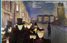
Título: Anochecer en Calle Karl Johan Año: 1902 Técnica: Óleo Dimensiones: 84,5 x 117 cm

Munch trabajó con gran maestría y cuidado sobre un lienzo que 1906 inspiró con moderación. Lo que dominó en su estilo coloreado, opaco, pero apagado. Más tarde, en 1910, volvió a pintar esta obra con colores más vivos y un efecto más dramático.