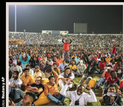
TRABAJADORES migrantes disfrutaron el partido inaugural del Mundial, ayer, en Doha.