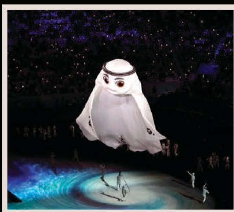
LA'EBB, mascota del evento, representa un turbante, prenda típica del país asiático.