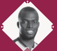
Tabla de goleo