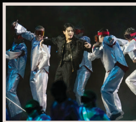
EL SURCOREANO Jungkook, ayer, en su presentación en la ceremonia de apertura.