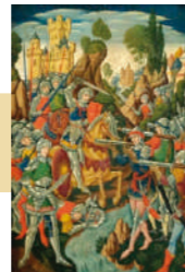
Escena de una batalla de caballeros en frente de un río Óleo sobre panel. 42x28,5 cm.