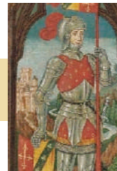
Paisaje de un caballero montado y un castillo más allá Óleo sobre panel. 38,8x14 cm.