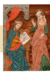
Dos miniaturas bíblicas Pigmento y hoja de oro sobre pergamino. 14,605x11,43 cm.