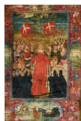
Los esposales de Santa Úrsula (1930) Acuarela en pergamino. 27x17,5 cm.

A pesar de que se sabe que son falsas, sus obras son adquiridas a propósito como es el caso del Museo de Victoria y Alberto (ubicado en Londres) y se ha creado un interés artístico genuino sobre su trabajo.