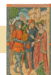
Encuentro entre un señor, una dama y un caballero Pintura. 25,5x16,2 cm.