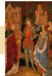
Los esposales de Santa Úrsula (1890) Óleo sobre panel. 45 cm x 34,9 cm.