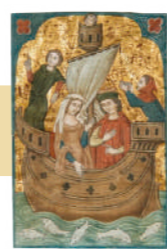
Pareja en un bote Trabajo sobre papel. 16,5x11,5 cm.