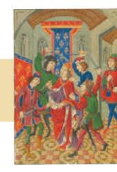
"De Vita Caesarum: Divus Lulius" Manuscrito sobre pergamino. 20,3x15 cm.