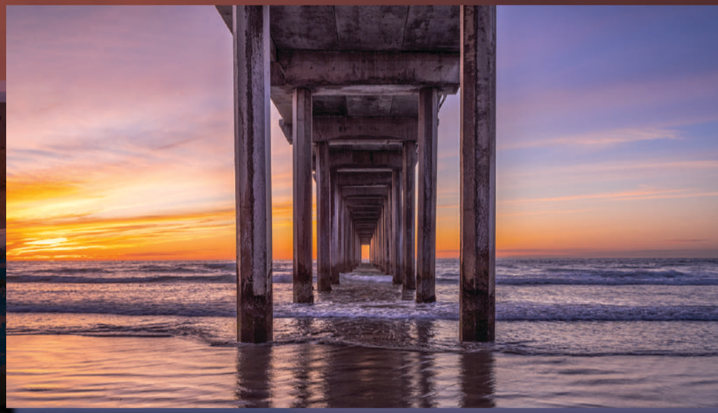
Scripps Pier, California