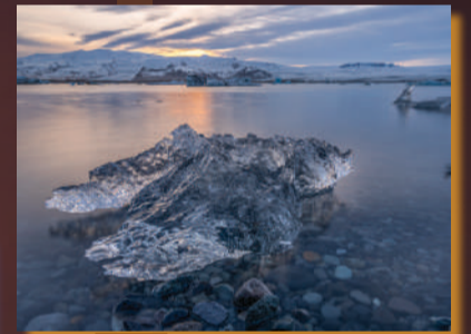
Diamond Beach, Islandia