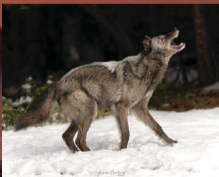
Lobo de tundra

Leopardo de las nieves, la especie que más le impuso al captarla con su lente, la fotógrafa tiene experiencia tomando felinos como pumas, leones y tigres.