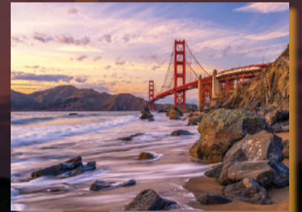
Golden Gate, San Francisco