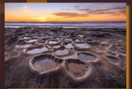
La Joya Tidepools, California