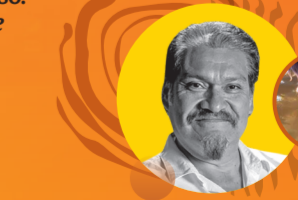
Otto Joaqu n Cosi 

El filme Garfield: fuera de casa se estrena hoy en las salas de cines de M xico, fecha en la que se conmemora el D a del Ni o y la Ni a.