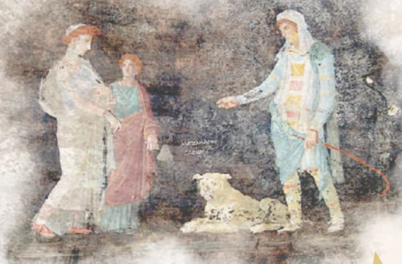
Encuentro entre Helena y Paris En la mitología griega, el rapto de Helena, por parte del hijo del rey troyano Priamo a su marido griego, Menelao, condujo a la Guerra de Troya.