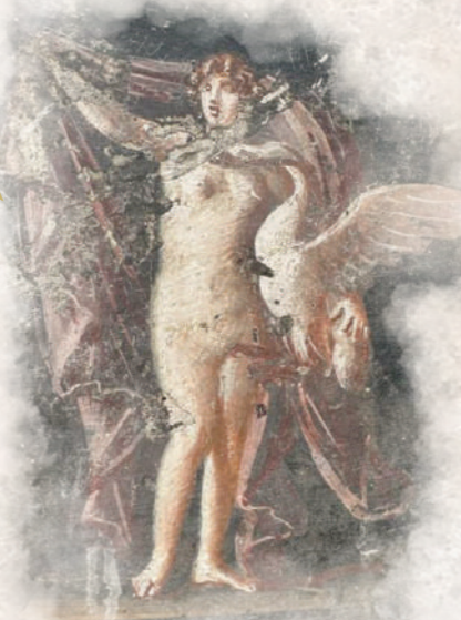
Mito de Leda y el cisne Mientras Leda caminaba por el río Eurotas, Zeus se transforma en cisne, el cual fingiendo estar en peligro, viola a Leda, como consecuencia de esta acción, pone dos huevos de los cuales nacen cuatro hijos: Helena, Polux, Clitemnestra y Castor.