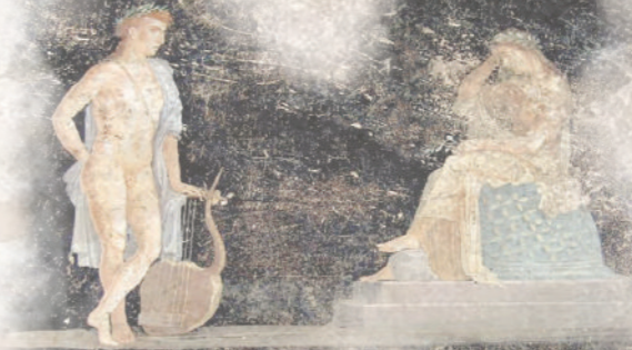
Cassandra, hija de Priamo, abatida, con el dios Apolo. Según cuenta la leyenda, Apolo le prometió a Cassandra el don de profecía pero, como ella no cedió a sus deseos, la castigó ordenando también que sus profecías nunca fueran creídas. Su advertencia sobre la caída de Troya, por ejemplo, no fue escuchada.